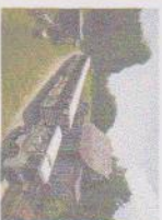
SENTIERS DE LA NATURE