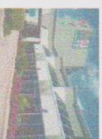
HÔTEL DU JARDIN

Départ à 8 h 30 direction La Chocolaterie des Pères Trappiste . La visite guidée nous fera connaître leur mode de vie. Suivra un court trajet vers le site Dégêces du Lac St-Jean , centre d'interprétation du bleuets. En route pour le dîner (inclus) au restaurant le Dédécieux. Après le repas, direction Zoo sauvage de St-Félicien , visite guidée, balade en train dans les sentiers de la nature. Vous profiterrez d'une période de temps libre pour la visite du site. Court trajet direction L'hôtel du Jardin . Souper (inclus) à 18 h 00. En soirée vers 21 h 30, c'est le spectacle son et lumière Anima Lumina