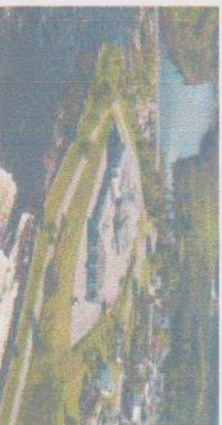
HÔTEL CHUTES DES PÈRES RIVIÈRE MISTASSINI

dée des fresques, des sentiers et du Jardin Scullion . C'est un incontournable. A 18 h 00 souper (inclus) à l'Hôtel.