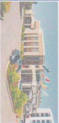
HÔTEL LE MONTAGNAIS

Suite à cette visite, direction Le jardin Saguenay, visite guidée d'un jardin privé. En route vers notre lieu de repos, L'Hôtel Le Montagnais. Souper (inclus) à 18h00 et soirée libre. Suite au repas, promenade sur le site du vieux port (facultatif).