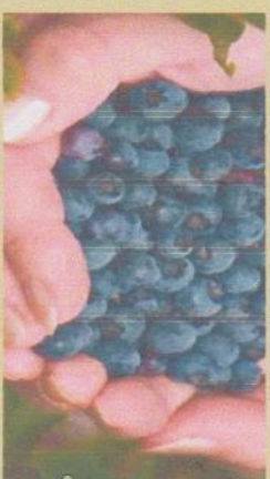
QUE DES GROS BIEUETS