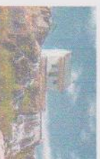
LA PETITE MAISON BLANCHE

Départ à 8 h 30, vers La Petite Maison blanche, icône du déluge du Saguenay. La visite guidée nous démontrera l'ampleur des traces que cet événement a laissé. Visite du Jardin Arboflora.