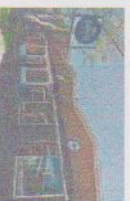
DÉGÊCES DU LAC